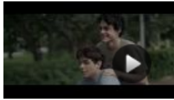
Heute gehe ich allein nach Hause - Trailer 1