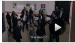
Kod Adi K.O.Z. - Trailer 1