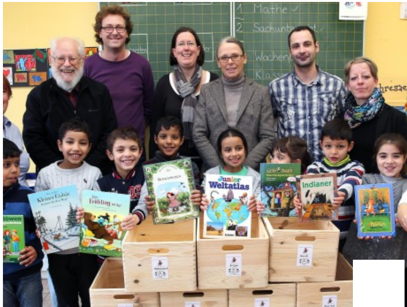
Leseförderung: Die Zweitklässler der Gotenschule freuen sich über ihre erste eigene Bücherkiste.

PLITTERSDORF. Projekt mit dem Verein "Kultur verbindet" Freudestrahlende Gesichter gab es gestern Mittag in der Gotenschule. Neun Kinder der zweiten Klasse, die an dem Projekt "Meine erste Bibliothek" teilgenommen hatten, erhielten die Bücher, die sie gemeinsam mit ihren Paten gelesen hatten, in jeweils einer Bücherkiste überreicht - zum Mitnehmen nach Hause.